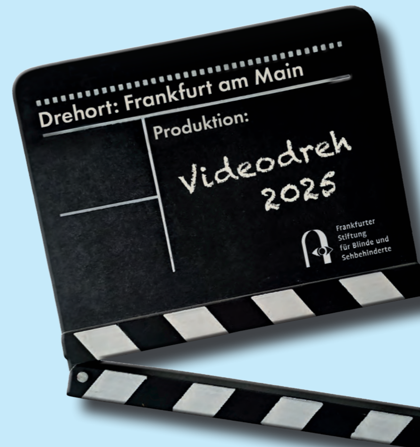
links: Im September 2025 wurde zum ersten Mal die Filmklappe für die Produktion unserer zwölfteiligen Videoreihe symbolisch geschlagen.

Um eine jüngere Zielgruppe anzusprechen und die Reichweite und Sichtbarkeit der Stiftung zu erhöhen, wurden die Videos zusätzlich für soziale Medien gekürzt und adaptiert. Soziale Medien sind schnell, interaktiv und niedrigschwellig. Hinsichtlich der Erstellung von Inhalten unterscheiden sie sich von den klassischen Massenmedien durch geringere Eintrittsbarrieren. Zunächst einmal wurde als Basis für alle Social-Media-Aktivitäten ein neuer Instagram-Account für die Stiftung ins Leben gerufen. Bei der Auswahl der Videos für die Plattform lag der Fokus auf den Themen „Inklusion“ und „Bewusstsein“ bzw. „Awareness“. Zur Zielgruppe gehören neben Blinden und Sehbehinderten auch alle anderen Nutzerinnen und Nutzer der sozialen Netzwerke. Wenn zum Beispiel in einem Sensibilisierungsvideo gezeigt wird, dass auf Gehwegen oder auf Leitlinien geparkte E-Scooter ein Hindernis für seheingeschränkte Menschen darstellen, hat dies einen anschaulichen, einprägsamen Lerneffekt. Auch Hilfsmittel wie Unterschriftsschablonen, Füllstandsanzeiger für Getränke oder Vorlesegeräte mit KI-Unterstützung können auf diesem Weg der interessierten Community nähergebracht werden. Last, but not least bietet der Instagram-Account der Stiftung die Möglichkeit, auch über diesen Kanal Veranstaltungen und Aktionen zu bewerben, dadurch ein breiteres Publikum zu erreichen und idealerweise ein Spendeninteresse zu generieren.