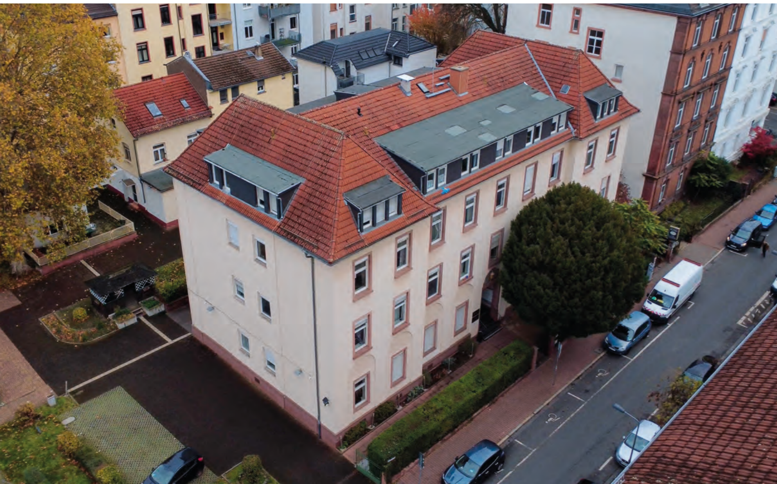
Aus der Vogelperspektive: Mit einer Drohne konnten im Rahmen der Videoproduktion Panoramaaufnahmen des Stiftungsgebäudes erstellt werden.

Im vergangenen Jahr trieb uns die Frage um, wie wir unsere Internetpräsenz weiter verbessern sowie unsere Schulungs- und Beratungsangebote anschaulicher darstellen können. Den Besucherinnen und Besuchern der Stiftungshomepage sollte es erleichtert werden, sich schnell und umfassend über unsere Arbeit zu informieren. Was verbirgt sich beispielsweise hinter einer Blindentechnischen Grundausbildung und wie läuft ein Training in Orientierung und Mobilität ab? So entstand die Idee, eine Videoreihe zu entwickeln, die – zusätzlich zur Textbeschreibung auf der jeweiligen Unterseite – genau diese Fragestellungen thematisch aufnimmt und beantwortet. Aus ersten Überlegungen formte sich ein Projekt, dessen Ziele es sind, unsere Stiftungsarbeit nahbarer zu machen, das Verständnis für blinde und sehbehinderte Menschen zu fördern sowie die Spendenbereitschaft langfristig und nachhaltig zu erhöhen.