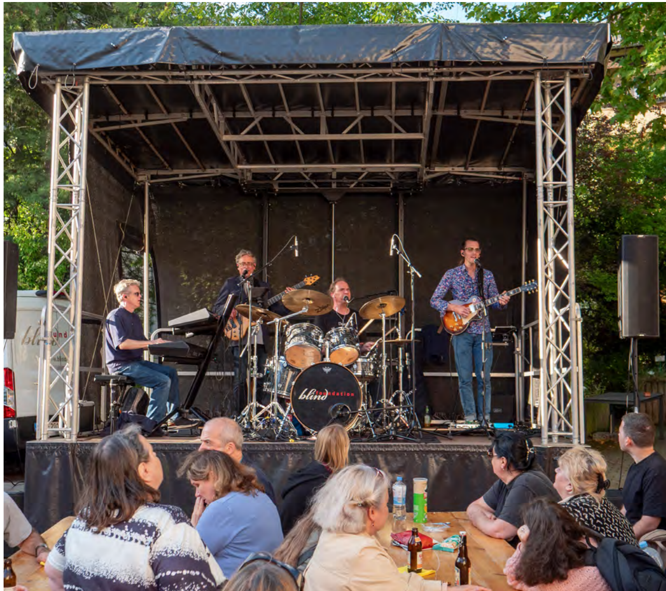
Beim Sommerfest der Stiftung unterhielt die inklusive Band Blind Foundation die Gäste mit eingängiger Livemusik.

„Rundum gelungen“ – so lautete das einhellige Fazit der Besucherinnen und Besucher von visioFrankfurt am 12. September 2025. Die Frankfurter Stiftung für Blinde und Sehbehinderte veranstaltete zum dritten Mal einen gemeinsamen Aktionstag, der die lokalen Anbieter im Bereich Sehbehinderten- und Blindenhilfe zusammenbringt und ihnen die Möglichkeit bietet, ihre Institutionen sowie ihre Hilfs- und Beratungsangebote auf dem Stiftungsgelände zu präsentieren.